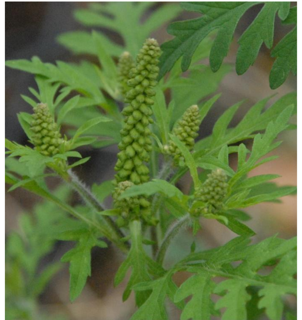
Epis de fleurs mâles (x1)